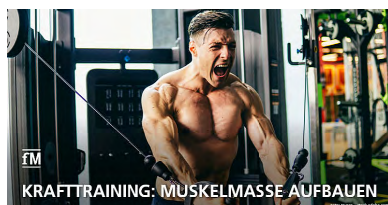
KRAFTTRAINING: MUSKELMASSE AUFBAUEN